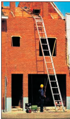
Ladderlift voor het vervoeren van producten naar het dak